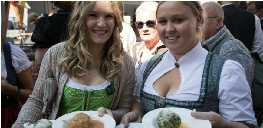
Ausgefallener Pulled-Pork-Knödel schmeckte besonders