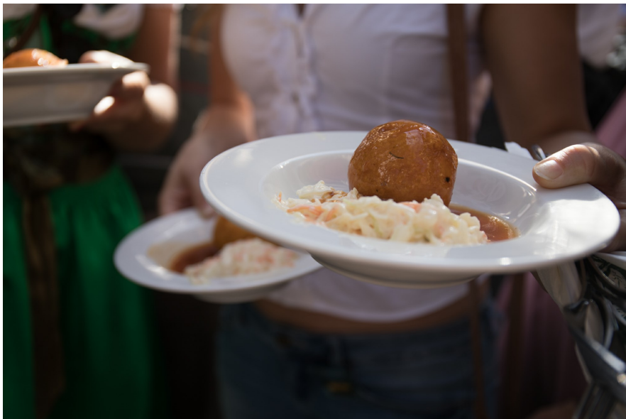
Ausgefallener Pulled-Pork-Knödel schmeckte besonders

Das alljährliche Knödelfest ist in St. Johann in Tirol längst eine herbstliche Tradition mit Kultstatus. Auch am vergangenen Wochenende kamen rund 17.000 Besucher, um die Knödelkreationen der regionalen Gastwirte zu genießen. Auf einer Länge von 500 Metern – so lang war der Knödeltisch noch nie - konnten sich alle Knödel-Liebhaber in der Speckbacherstraße nach Herzenslust kulinarisch verwöhnen lassen. Insgesamt umfasste das Angebot bei der 36. Auflage des Festes 26.000 Stück Knödel, von süß bis pikant war für jeden Geschmack etwas dabei. „Für uns war es ein sehr langer, aber auch sehr erfolgreicher Samstag. Das Wetter hat zum Glück gut mitgespielt, die Besucher haben sich wohl gefühlt und das Angebot sehr gut angenommen“, resümiert Maximilian Blumschein, Betreiber des Hotel & Wirtshaus Post zufrieden.