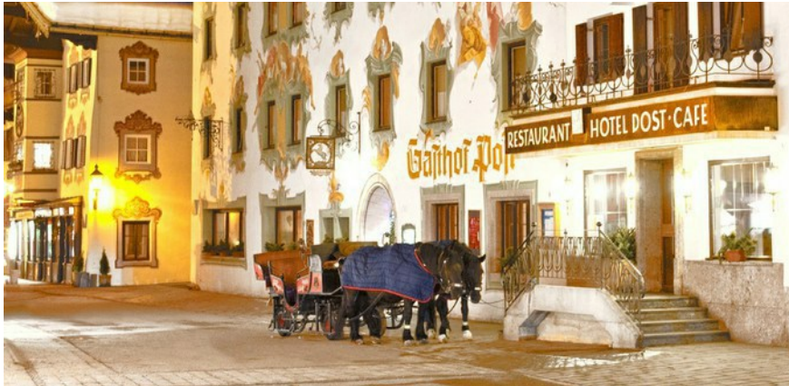
Hotel Post - für einen traumhaften Urlaub